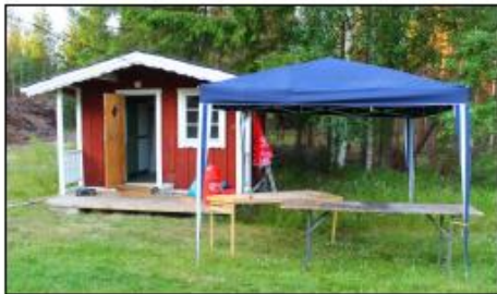
Öppetider Cottagegarderober: Efter middagen

Lägg din insändare i brevlådan vid anslagstavlan /redaktionen