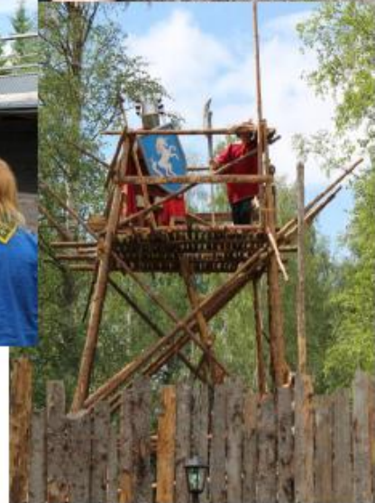
Lite bilder från dagens äventyr