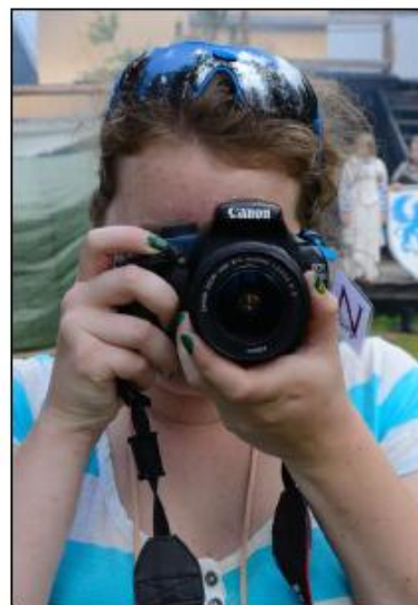
KARIN JOBBAR HÅRT MED ATT DOKUMENTERA